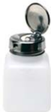
Pumpe mit Verriegelung